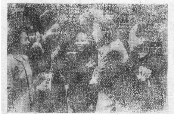
五十年代，许广平在全国妇代会上与少数民族代表谈话。

一丝不苟，校对稿件连一个标点的差错，也不放过。但对自己的生活却要求不高，朴素得很，衣服常打过补丁还穿，一件长衫穿许多年，一双胶鞋也多年不舍得丢。婚后，我悉心照顾他的生活，才算逐步好一些。我们家中，无高档家具和华丽的陈设，有的只是书籍。鲁迅对母亲十分孝敬，除按时寄款赡养老人外，离京后还多次专程去北京探望老母亲。二弟周作人夫妇，虽然在北京，却很少负担母亲的生活，其日本太太更是难处，尖酸刻薄，拨弄是非，搞得家里不团结，最后不得不搬开另过。鲁迅对于这些问题，总是以长兄身份宽怀大度，从不斤斤计较，对侄儿侄女，则爱护备至，象对待自己亲生子女